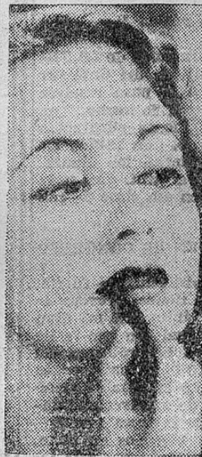
Olivia de Havilland Estrella de Warner, Bros.

Es SUPERINDELEBLE... constituye el maquillaje perfecto para labios que Max Factor, el genio del maquillaje de Hollywood, creó para las estrellas. En armonía de colores, para rubias, trigueñas y pelirrojas. A prueba de agua... de color permanente.